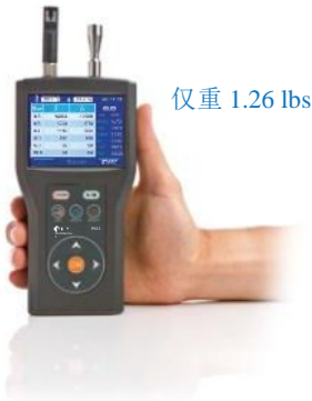
仅重 1.26 lbs

Airy Technology P611用于测量流速在0.1 CFM (2.83 LPM) 粒径为0.3~ 10 \mu m 的粒子。